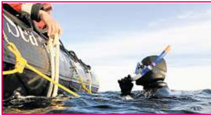
Bereit: Schnorchel und Taucherbrille sitzen, gegen das Eiswasser schützt ein dicker Taucheranzug.

Er wackelt fröhlich mit dem Kopf. Belugas gehören zu den wenigen Walarten, die ihren Nacken bewegen können. Und: Sie unterhalten sich gerne mit ihren Artgenossen. Dabei brummen, quieken und zwitschern sie. Daher werden sie auch Sänger der Eismeere genannt.