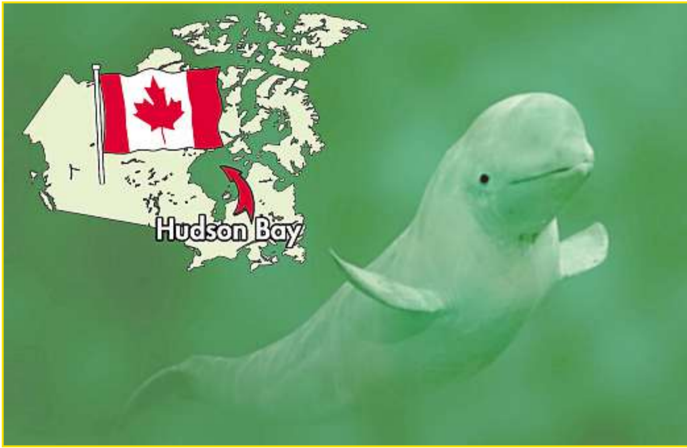
Belugas lieben eiskaltes Wasser. In der Hudson Bay in Kanada tummeln sich im Sommer hunderte Wale. Touristen können sie in ihrem Element besuchen und mit ihnen tauchen.Grafik: Retter